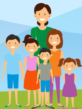
КӨП БАЛАЛЫ АНАЛАР «АЛТЫН АЛҚА», «КҮМІС АЛҚА»