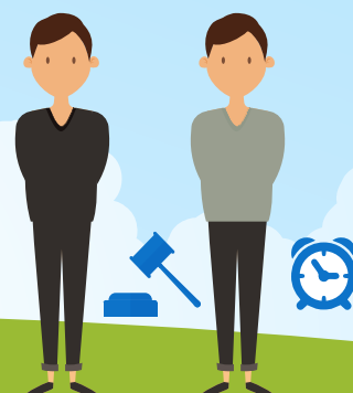
СОТ ҮКІМІМЕН ЖАЗАСЫН ӨТЕЙТІН ТҰЛҒАЛАР УАҚЫТША ҚАМАУ ЖӘНЕ ТЕРГЕУ ИЗОЛЯТОРЫНДА ОТЫРҒАН ТҰЛҒАЛАР