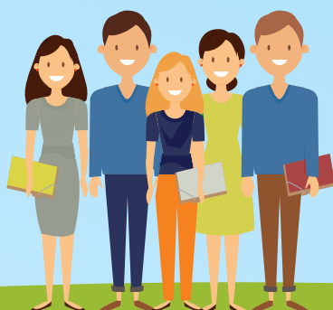
КОЛЛЕДЖ, КТУ, ИНСТИТУТ, УНИВЕРСИТЕТТЕРДЕ КҮНДІЗГІ БӨЛІМДЕ ОҚИТЫН СТУДЕНТТЕР