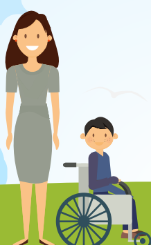
18 ЖАСҚА ДЕЙІНГІ МҮГЕДЕК БАЛАЛАРҒА КҮТІМ ЖАСАЙТЫН ЖҰМЫС ІСТЕМЕЙТІН АЗАМАТТАР