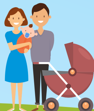
ЖҮКТІ ӘЙЕЛДЕР, БАЛА 3 ЖАСҚА ТОЛҒАНҒА ДЕЙІНГІ МЕРЗІМДЕ ДЕКРЕТТІК ДЕМАЛЫСТАҒЫ ТҰЛҒАЛАР